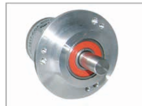
Absoluter Drehgeber WDGA58B