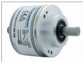
Inkrementaler Drehgeber WDG158B

Stellen Sie sich Ihr System passend für Ihre Schachtkopierung zusammen, indem Sie sich Ihren Drehgeber auswählen und die Länge des Spezialzahnriemens bestimmen.