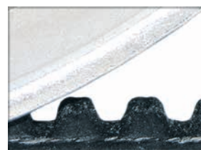
Spezialzahnriemen für sehr leises und schlupffreies Messen.