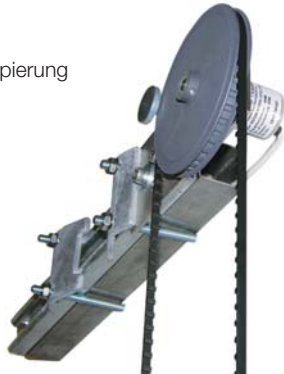
Umlaufende digitale Schachtkopierung