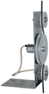
Mitlaufende digitale Schachtkopierung