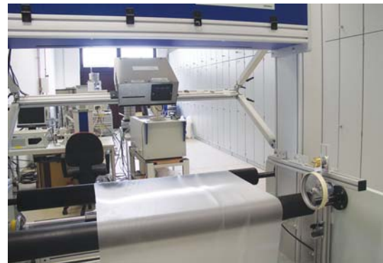
Geschwindigkeitsmessung zur Qualitätsüberwachung bei Folien