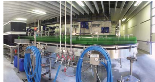
Positionsmessung bei Flascheninspektionen