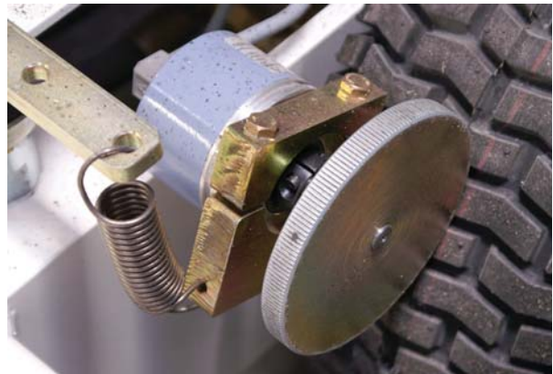
Drehgeber WDG 58B zur Wegmessung