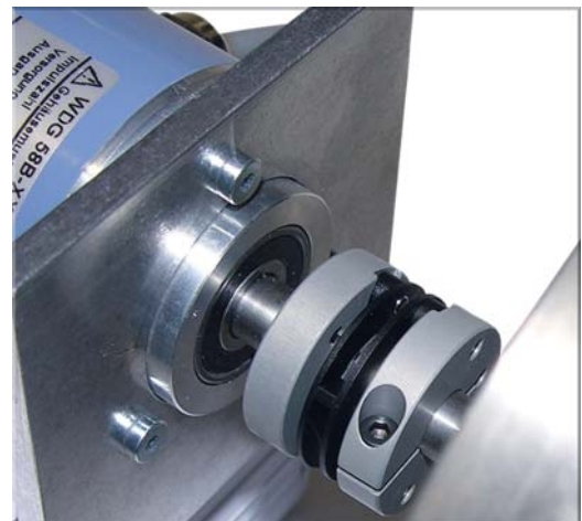
Drehgeber mit Montagewinkel und Kupplung an Motor