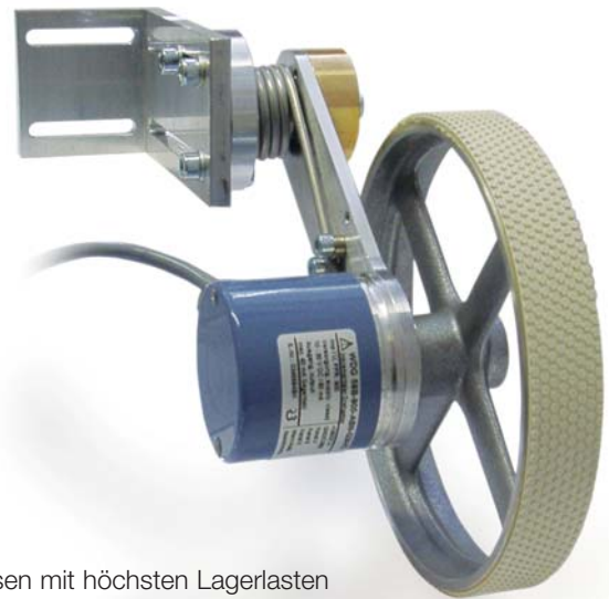
Messen mit höchsten Lagerlasten

... wir nehmen uns Ihrer Aufgabenstellung an und lösen diese.