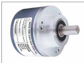
Inkrementaler Drehgeber WDG58B

Stellen Sie sich Ihr System passend für Ihre Schachtkopierung zusammen, indem Sie sich Ihren Drehgeber auswählen und die Länge des Spezialriemens bestimmen.